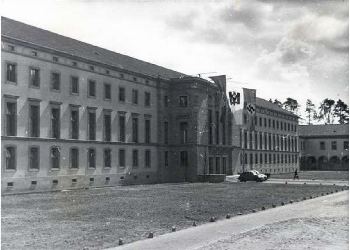
Das ehemalige Präsidialgebäude des DRK in Babelsberg im Jahr 1943

Der Sitz der DRK-Führungsspitze war am 1. Juli 1939 von Berlin nach Potsdam-Babelsberg verlegt worden. Das alte Verwaltungsgebäude in der Berliner Hanseemannstraße Nr. 10 war zu klein geworden und genügte den neuen Anforderungen nicht mehr, die das DRK im Staate Adolf Hitlers zu erfüllen hatte. Außerdem sollte die Organisation der Hilfsgesellschaft auf den geplanten Kriegseinsatz ausgerichtet werden.